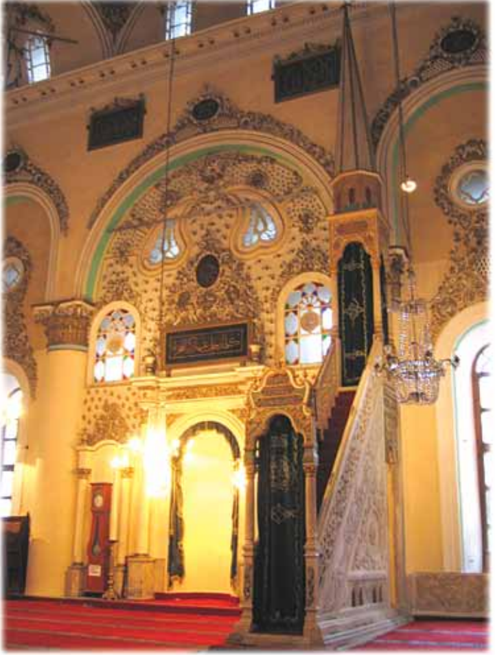
Hisar Camii İç Görüntüsü